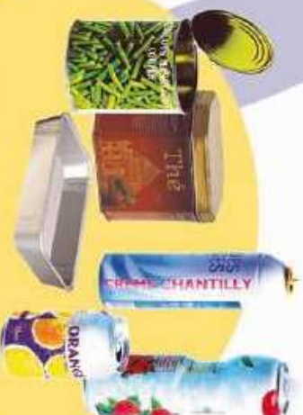
Conserves, canettes, aérosols et barquettes

En vrac, bien vidés, aplatis et sans les imbriquer