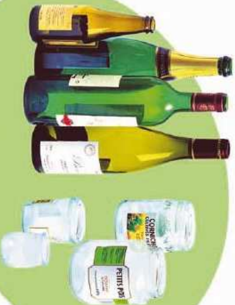
Bouteilles, bocaux et pots en verre

Sans les bouchons, capsules et couvercles