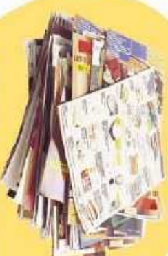
Journaux, magazines, prospectus