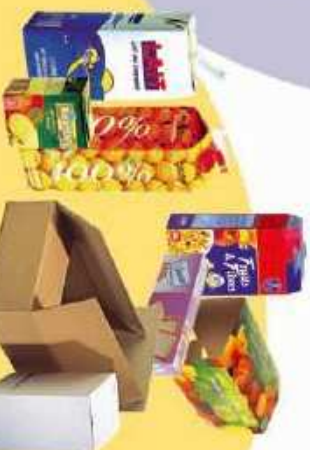
Boîtes en carton, cartonnettes et briques alimentaires