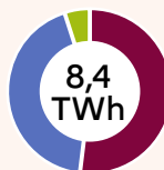
Gisements de chaleur fatale dans les UIOM, Data Center et STEP